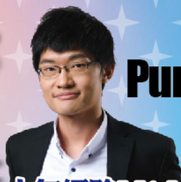
Pung Sir @DHMP