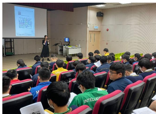
獲學校邀請分享中文知識