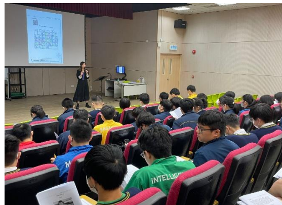
獲學校邀請分享中文知識